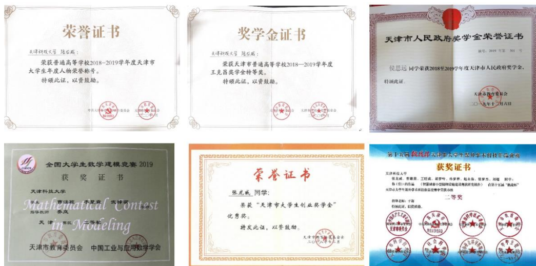
图 5 学生获奖

学生获奖： 在各类全国及省市竞赛中成果突出，曾获天津市高校“大学生年度人物”、王克昌特等奖学金、天津市人民政府奖学金，多项全国大学生数学建模竞赛国家二等奖和天津市一等奖，全国大学生英语竞赛二等奖，挑战杯竞赛中获得天津市一等奖，二等奖，天津市大学生物理竞赛一、二等奖，天津市大学生物理知识大赛二等奖，天津市大学生英语竞赛一等奖等。