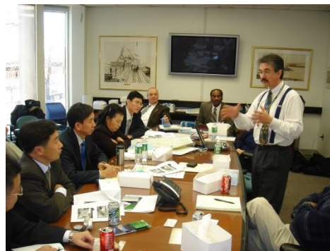
图 4 国际交流

学生获奖： 在各类全国及省市竞赛中成果突出，曾获天津市高校“大学生年度人物”、王克昌特等奖学金、天津市人民政府奖学金，多项全国大学生数学建模竞赛国家二等奖和天津市一等奖，全国大学生英语竞赛二等奖，挑战杯竞赛中获得天津市一等奖，二等奖，天津市大学生物理竞赛一、二等奖，天津市大学生物理知识大赛二等奖，天津市大学生英语竞赛一等奖等。