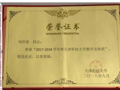
图4 天津科技大学教学名师证书