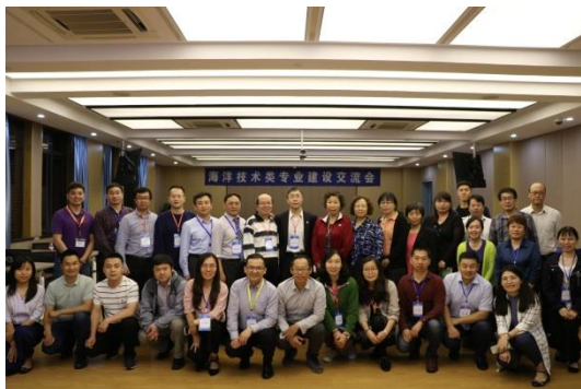
图 3 国内交流