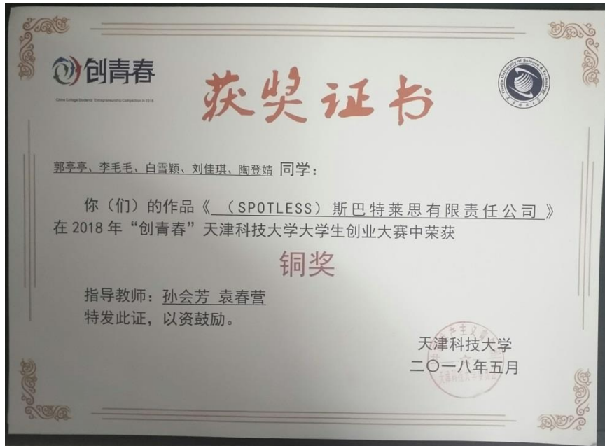
图 9 天津科技大学创青春创业大赛铜奖

毕业生发展： 毕业生可在各级海洋监管部门、环保机构、高等院校、科研机构以及水产、渔业部门等相关的企事业单位和行政管理部门，从事海洋相关理论与应用研究和技术研发等工作，或在本学校或其他高等院校和科研机构继续深造，攻读研究生学位。每年考研、保送及出国留学人数占应届毕业生 30%以上。2020 年考取研究生人数比例位列全校第二。近几年考取的涉海研究所主要有：中国科学院海洋研究所、中国科学院南海研究所、自然资源部第一海洋研究所、第三海洋研究所等。考取的高校主要有：武汉大学、天津大学、南开大学、厦门大学、中国海洋大学、大连理工大学、华南理工大学、浙江工业大学、宁波大学等。还有部分学生到美国、英国、加拿大、澳大利亚等高校和科研机构继续深造。