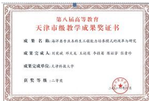
图3 天津市教学成果奖证书

师资力量: 本专业聚集了海洋生物和海洋化学方面优秀的教学和科研人才。现有固定教学和科研人员 35 人, 其中教育部长江学者特聘教授 1 人, 天津市特聘教授 2 人, 天津市学科领军人才 1 人, 校级教学名师 1 人, 教授 9 人、副教授 6 人, 博士生导师 3 人, 硕士生导师 13 人, 外籍教师 3 人。近 5 年来先后承担包括国家重大专项、国家自然科学基金、863 项目和国际合作项目在内的各类科研项目 50 余项, 获得天津市自然科学二等奖、天津市科技进步二等奖、天津市教学成果奖等省部级科技奖励 4 项, 申请及授权发明专利 30 项, 出版教材专著 6 部。