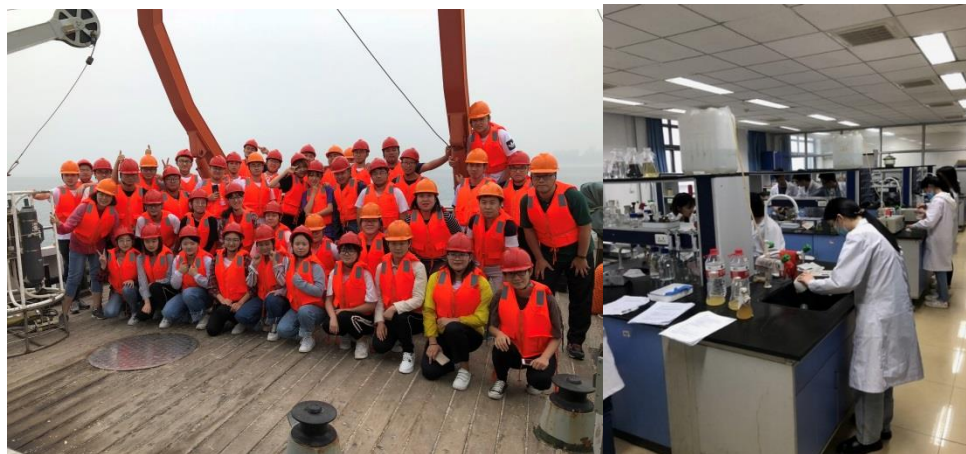
图1 海洋调查与观测出海实习

专业特色: 海洋科学以近岸海域海洋生物及海水化学资源为主, 兼顾大洋生态系统、高盐水体生态环境修复、卤水生物资源的开发应用, 突出与环境科学、生物工程等学科的交叉与融合, 在海洋资源利用及海洋生态学方面形成自己的专业特色。同时, 依托天津滨海新区得天独厚的区位优势, 本专业在海洋生物资源利用、印度洋生态、海洋溶液化学、卤水生物资源开发与利用等研究方向上具有明显的专业优势, 在国内外有一定知名度。