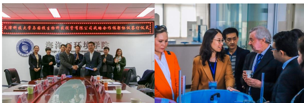
图 5 与国投生物科技投资有限公司签署合作协议

合作交流： 海洋科学专业坚持对外学术交流和国际合作，一直以来在产学研企业对接、举办国际会议、师资引进、留学生来华学习以及在校生国际教育等方面不断突破，努力搭建具有国际视野的文化交流教育平台。本专业目前与东盟国家渔业教育网络、国投微藻生物科技投资有限公司、曹妃甸蓝色海洋科技有限公司等涉海国内外企业签署合作框架协议。主办“卤虫生物学研究与水产养殖应用”国际研讨会，与联合国粮农组织合作开展高盐水体生物资源研究。与美国南加州大学、加拿大 Bedford 海洋研究所、加拿大魁北克大学、新西兰奥塔哥大学、比利时根特大学、香港科技大学、马来西亚登嘉楼大学等高校有交换培养研究生、青年教师等合作关系，常年聘请美国、加拿大、韩国等海洋类外籍专业教师来校任教。同时，本专业还不断鼓励优秀中青年教师出国（境）访学深造，积极参加国际学术会议等。海洋科学专业已接受哈萨克斯坦、斯里兰卡、巴基斯坦、印度、越南等一带一路国家来华留学生，涵盖本科生、硕士生及博士生等培养层次。对于我校在校生，本专业坚持扩大学生对外交流规模，不断鼓励在校学生“走出去”，开拓国际视野，丰富学习经历。近年来，本专业学生考取国外硕、博研究生人数均逐渐增多。